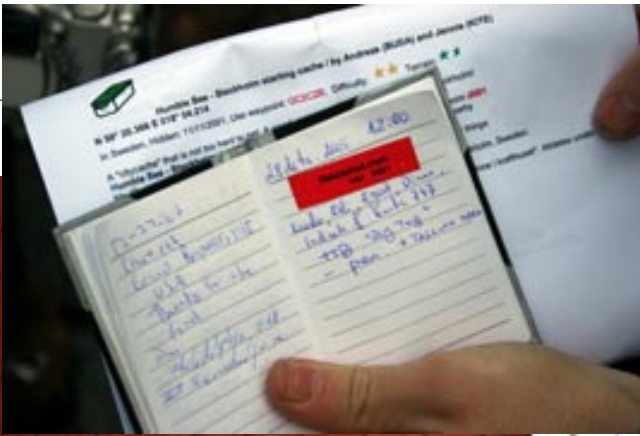
Logiraamat - kui aare leitud, jäetakse endast kirjalik jälg.